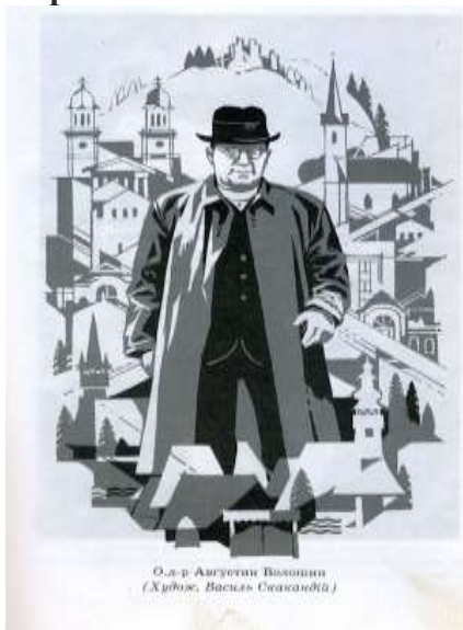
О.р. Августин Волошин (Худож. Василь Скакандій)